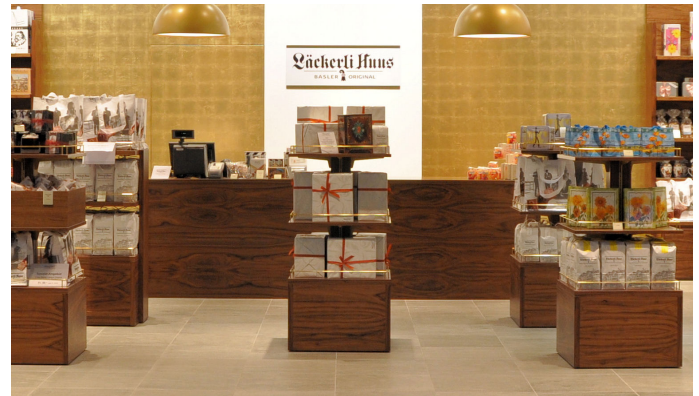
Die Kunden des Lächerli Huus erwarten süsse Versuchungen. Damit verbunden sind innovative Logistikprozesse, welche durch das ERP-System toasca des Schweizer Lösungsanbieters dynasoft unterstützt werden

Wie bewerkstelligt man den Umzug eines ganzen Unternehmens, ohne dass Chaos ausbricht, und optimiert gleichzeitig die Logistik- und Fertigungsprozesse? Für Dieter Mögerle und das dynasoft Projekt-